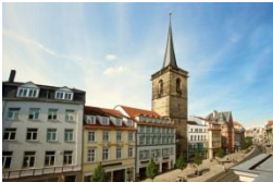
Hotel Zumnorde am Anger